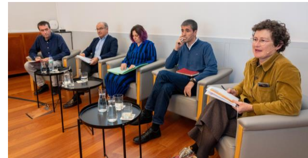
Jornada EDEKA: IA y discapacidad. Bilbao, noviembre 2024.