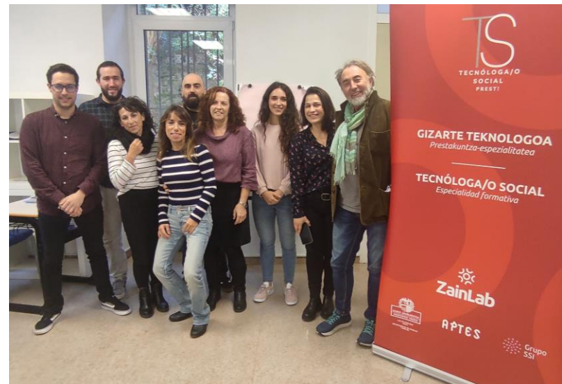
Imagen de las personas participantes en el piloto, noviembre 2024.

Inscripción en catálogos Lanbide y SEPE, en ambos casos.