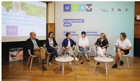
Curso de Verano: Nueva Agenda Estratégica de Innovación. Donostia, septiembre, 2024.