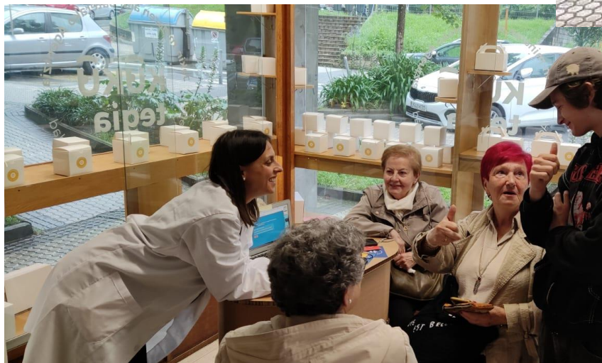
Izquierda: Participantes de KUKU en la KUKUtegia, Agencia Temporal de la Curiosidad, junio 2024.