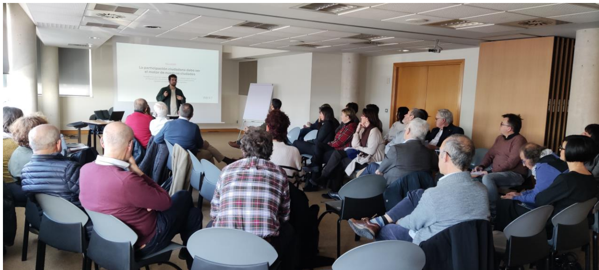
Asamblea General de APTES en Tecnalia, Donostia/San Sebastián, marzo 2024.