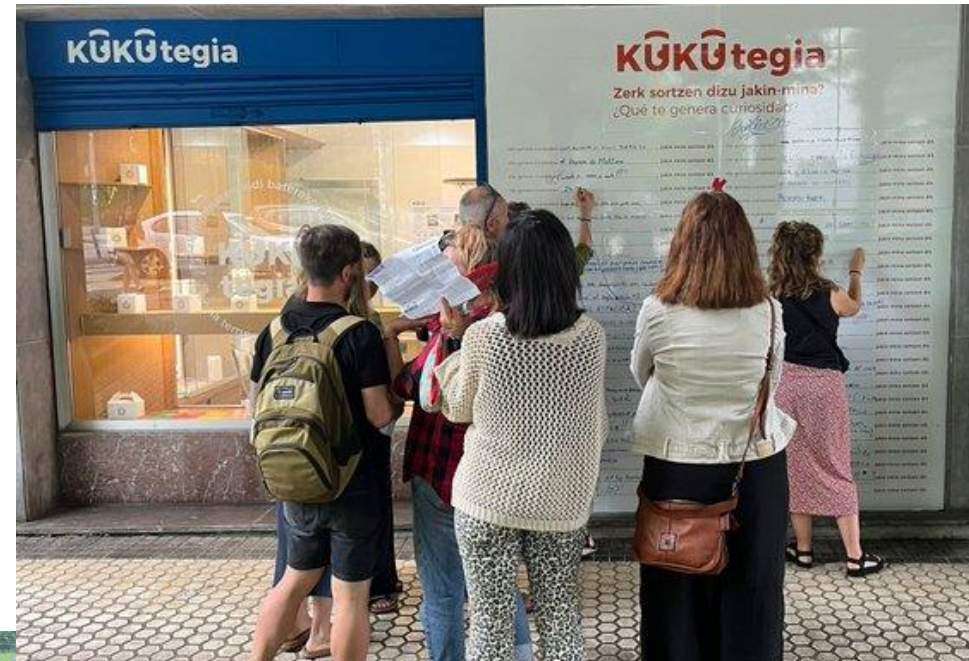
Arriba: Exterior de la KUKUtegia, Agencia Temporal de la Curiosidad, junio 2024.

Generar un espacio seguro, de confianza, en un entorno de proximidad y vida cotidiana, en el que las personas puedan ser protagonistas y tomar conciencia de su capacidad de ser agentes de cambio en su barrio y en la sociedad.