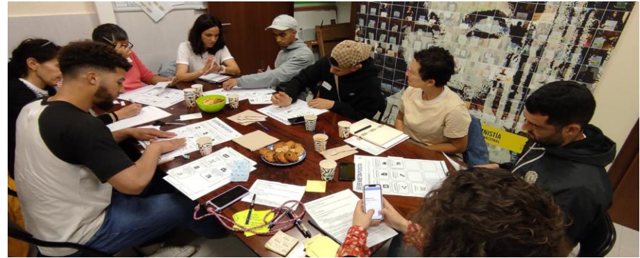
Taller i-Gizarte para testeo de usabilidad con personas usuarias, junio 2024.