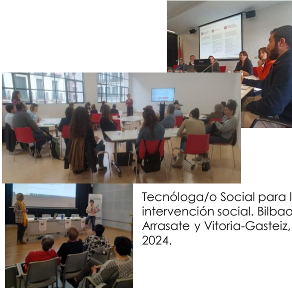
Tecnóloga/o Social para la intervención social. Bilbao, Arrasate y Vitoria-Gasteiz, 2024.