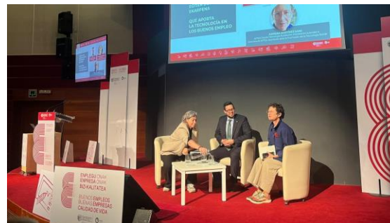
Congreso de Empleo: IA y empleo. Vitoria, octubre 2024.