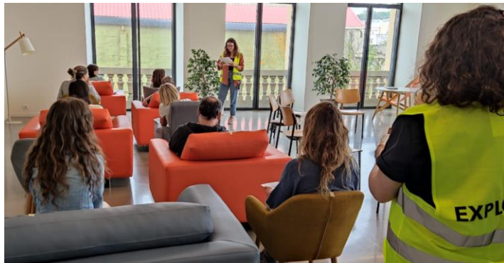
Taller i-Gizarte con profesionales, mayo 2024.

Entender de qué manera las personas en riesgo o situación de vulnerabilidad documental acompañadas por entidades del Tercer Sector y sus profesionales, pueden ver facilitado su proceso de integración social gracias a contar con sus documentos personales organizados en METAPOSTA.