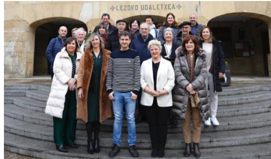
Presentación BIBE Bizitza Berria eta Betea. Lezo, marzo, 2024.