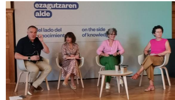
Curso de Verano: Los desafíos de la nueva longevidad. Donostia, julio 2024.