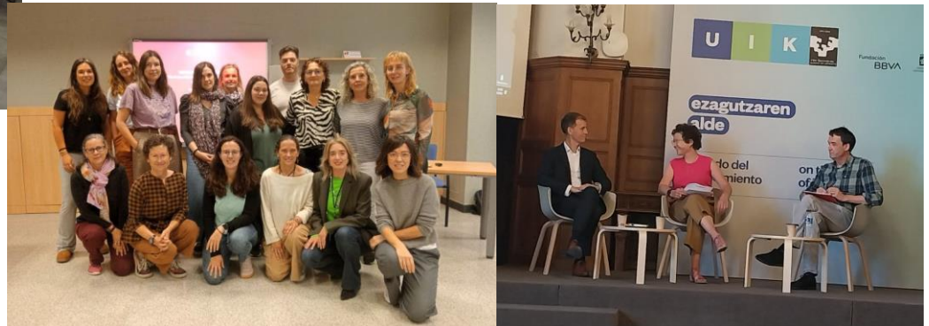
ZainPrest y Zaintalent, mayo 2025