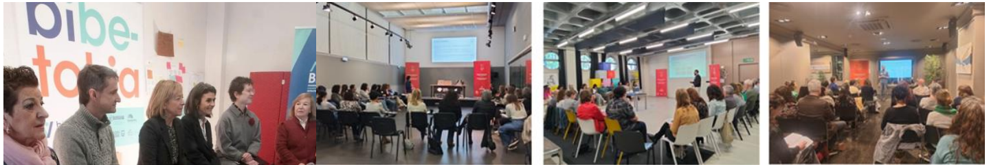
Encuentros Aceleración Organizativa, abril 2025