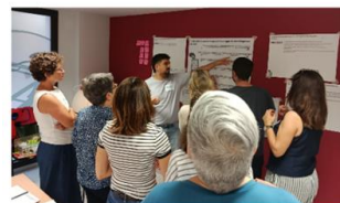
SIRIMIRI SERV. SOCIALES