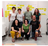
KOOPERA SS y F