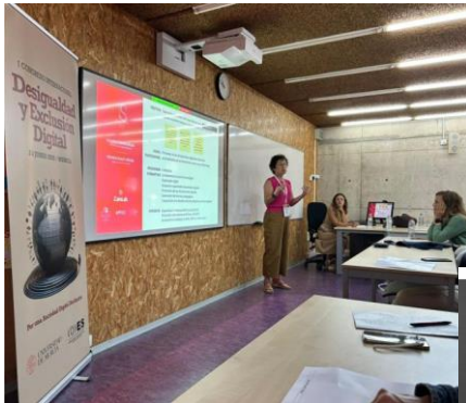
Congreso Desigualdad y Exclusión Digital, Murcia, junio 2025