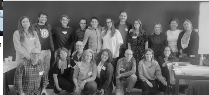
Seminario KIDEON, EHU, noviembre 2025