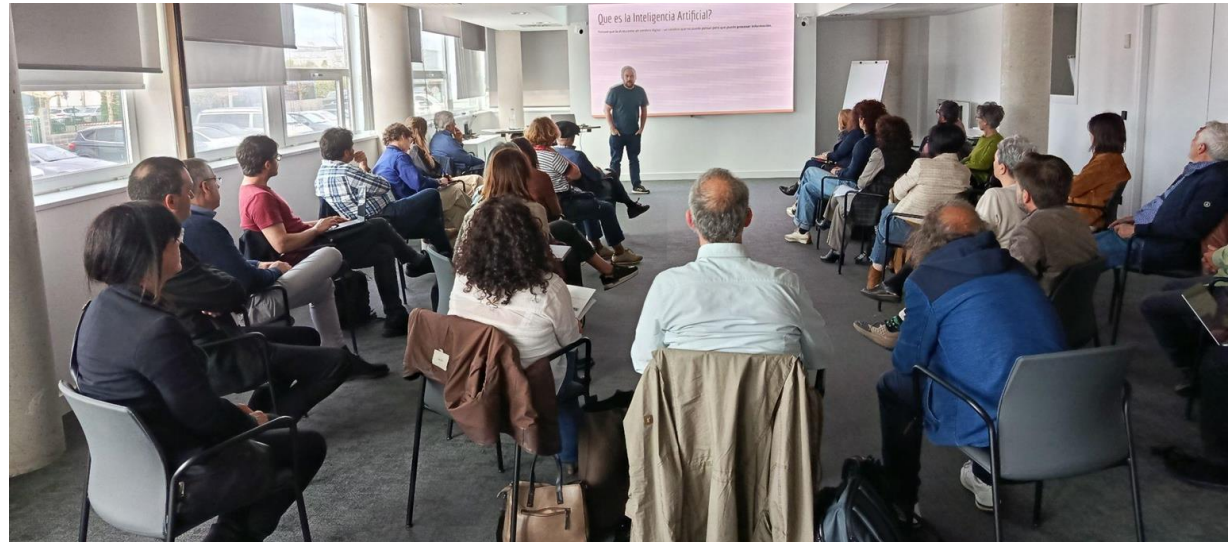
Asamblea General de APTES en Tecnalia, Donostia/San Sebastián, abril 2025.