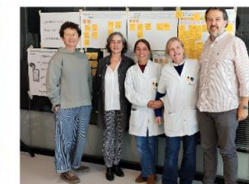
CENTRO RAFAELA MARIA