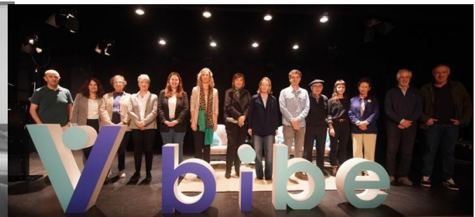
BIBE: Presentación resultados, septiembre 2025